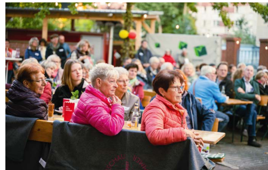
Das erste Treffen der Ehrenamtlichen war ein bunter Kennenlern-Abend.

Landesgartenschau 2027 Wittenberge gGmbH Perleberger Straße 165 19322 Wittenberge Telefon 0176 . 13 99 44 34 info@laga-wittenberge.de www.laga-wittenberge.de