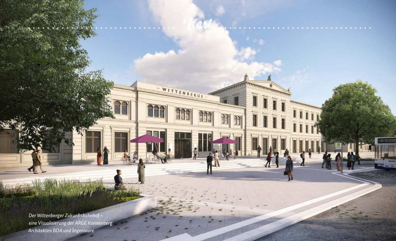
Der Wittenberger Zukunftsbahnhof – eine Visualisierung der ARGE Kannenberg Architekten BDA und Ingenieure