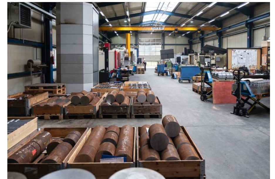
In der Werkhalle warten Rohlinge darauf, zu hochpräzisen Werkstücken verarbeitet zu werden.