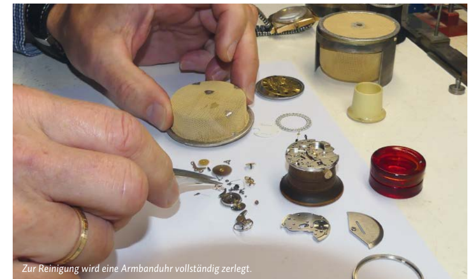
Zur Reinigung wird eine Armbanduhr vollständig zerlegt.

gelernt und war 1986 ebenfalls Meister im Uhrmacherhandwerk geworden.