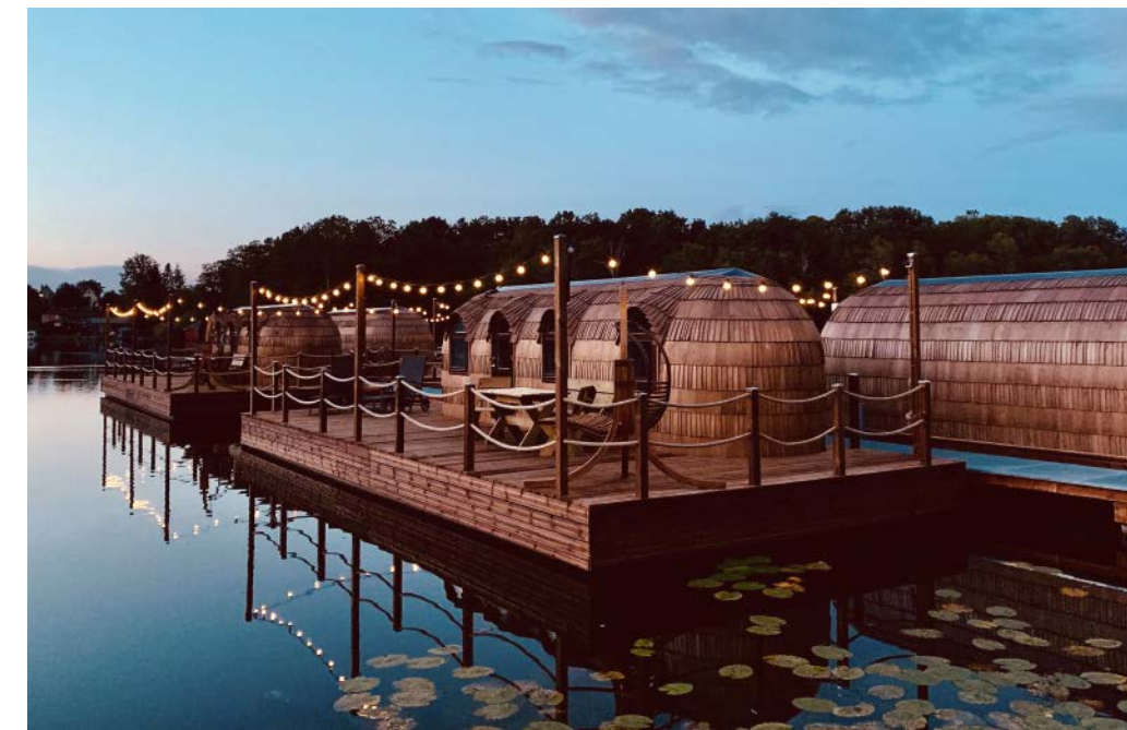
Diese ungewöhnlichen Ferienhäuser sollen im Nedwighafen schwimmen.