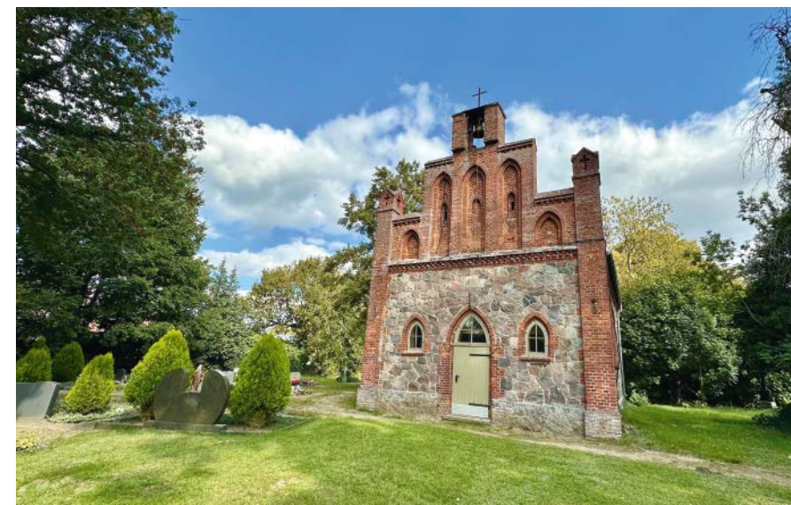
Die Kirche mit ihrem Schaugiebel aus Backsteinen.

29. November ab 14 Uhr, am Dorfgemeinschaftshaus – mit Musik, Selbstgemachtem und weihnachtlicher Stimmung