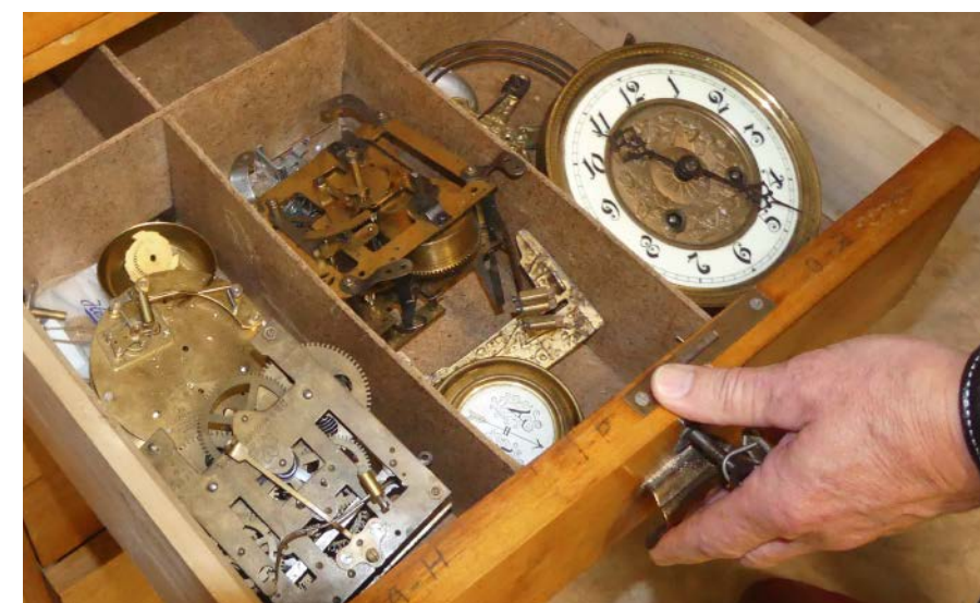
Alte Regulatorenteile im Ersatzteil-Schubfach