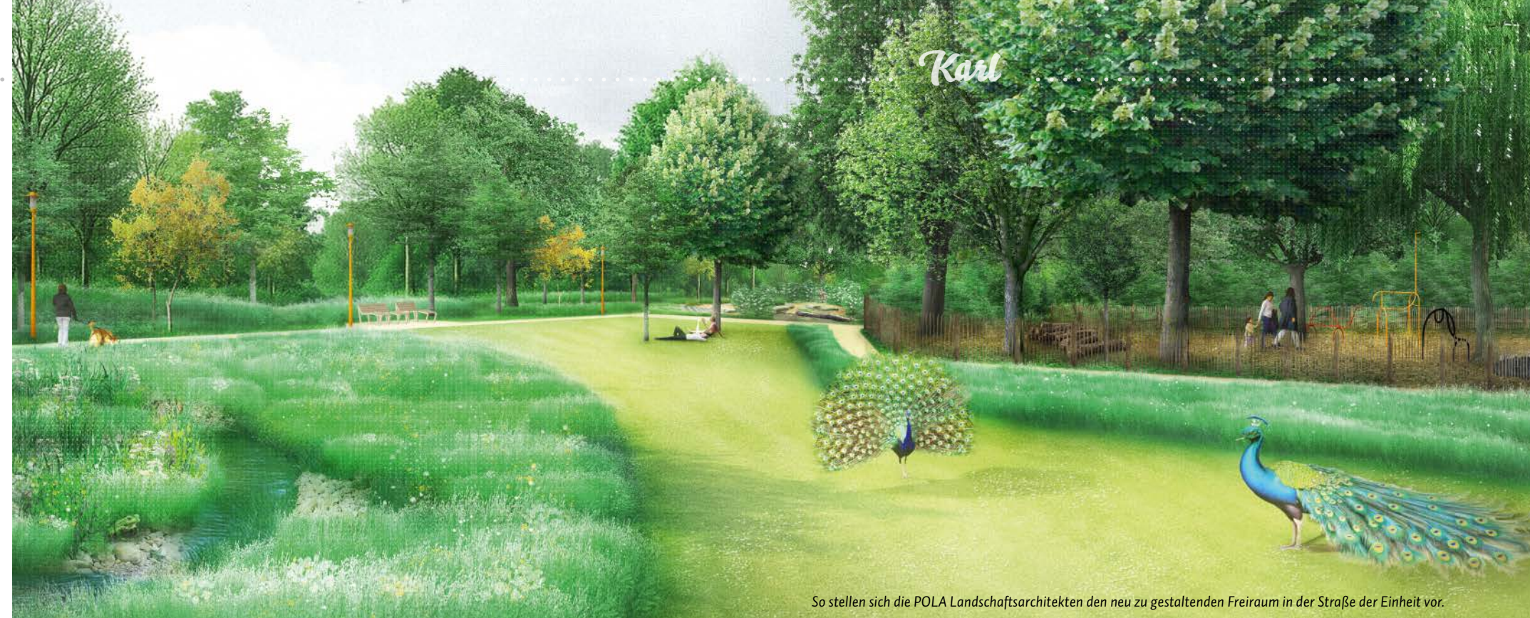
So stellen sich die POLA Landschaftsarchitekten den neu zu gestaltenden Freiraum in der Straße der Einheit vor.

Mo 8 – 12 und 14 – 17 Uhr; Do 10 – 12 Uhr