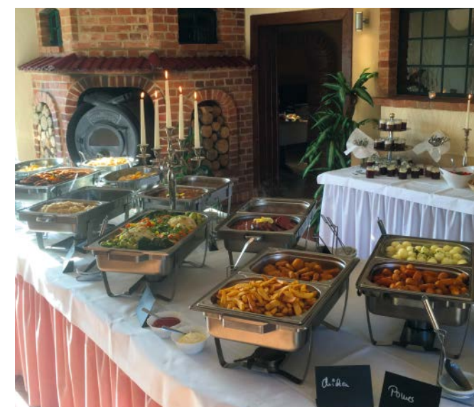
Im Restaurant wird besonderer Wert auf eine hohe Qualität der Speisen gelegt.