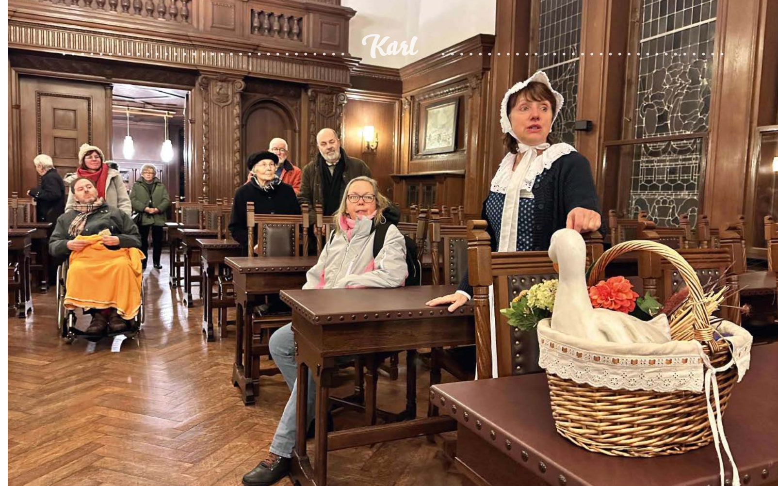
Hinter einer Adventstür verbirgt sich auch in diesem Jahr wieder das Wittenberger Rathaus. Im vergangenen Jahr konnte man an einer Führung durch die Repräsentationsräume und einen Aufstieg auf den Rathaukturm teilnehmen.

Adventskalender soll es spannend bleiben. Ich kann aber erzählen, dass im vergangenen Jahr gemeinsam gesungen wurde, es Plätzchen, Waffeln, Gegrilltes und heiße Getränke gab. Geschichten wurden vorgelesen und sogar ein kleiner Adventsbasar fand statt.«