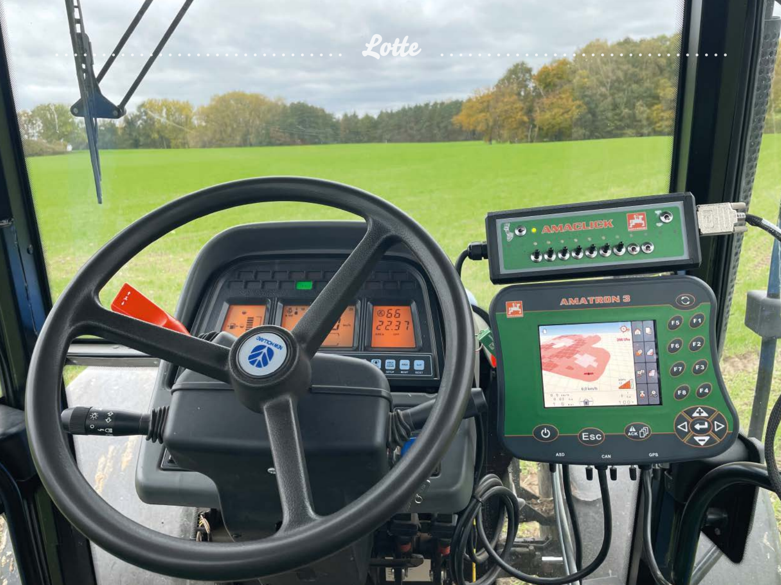
Auch in älteren Traktoren kann mit GPS und Applikationskarten gearbeitet werden.