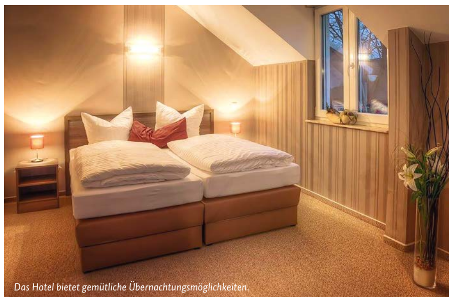
Das Hotel bietet gemütliche Übernachtungsmöglichkeiten.

Das Hotel mit 40 Betten bietet eine ruhige und gemütliche Übernachtungs-