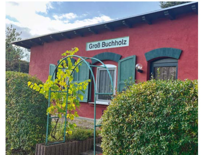
Einst war Groß Buchholz eine Station der Westprignitzer Kreisringbahn. Das ehemalige Stationsgebäude – heute ein Wohnhaus – erinnert daran.

eingeweiht. »Das war ein ganz besonderer Tag«, erinnert sich die Ortsvorsteherin. »Fast das ganze Dorf war da. Es war unser gemeinsames Werk – von der Idee bis zum Einrichten.«