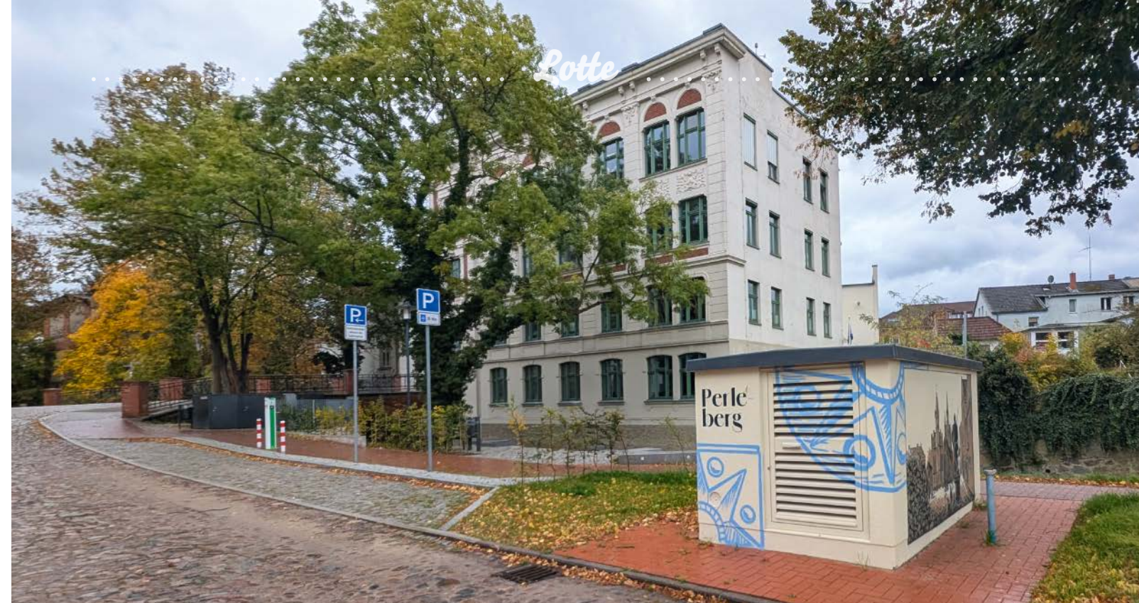
An der Stelle eines alten, unansehnlichen Trafo-Gebäudes in der Grabenstraße errichtete die PVU eine moderne, mit Lokalkolorit gestaltete Trafostation und eine E-Ladesäule für Pkw.

Blick über Perleberg aus der Vogelperspektive, im Vordergrund das Verwaltungsgebäude der PVU