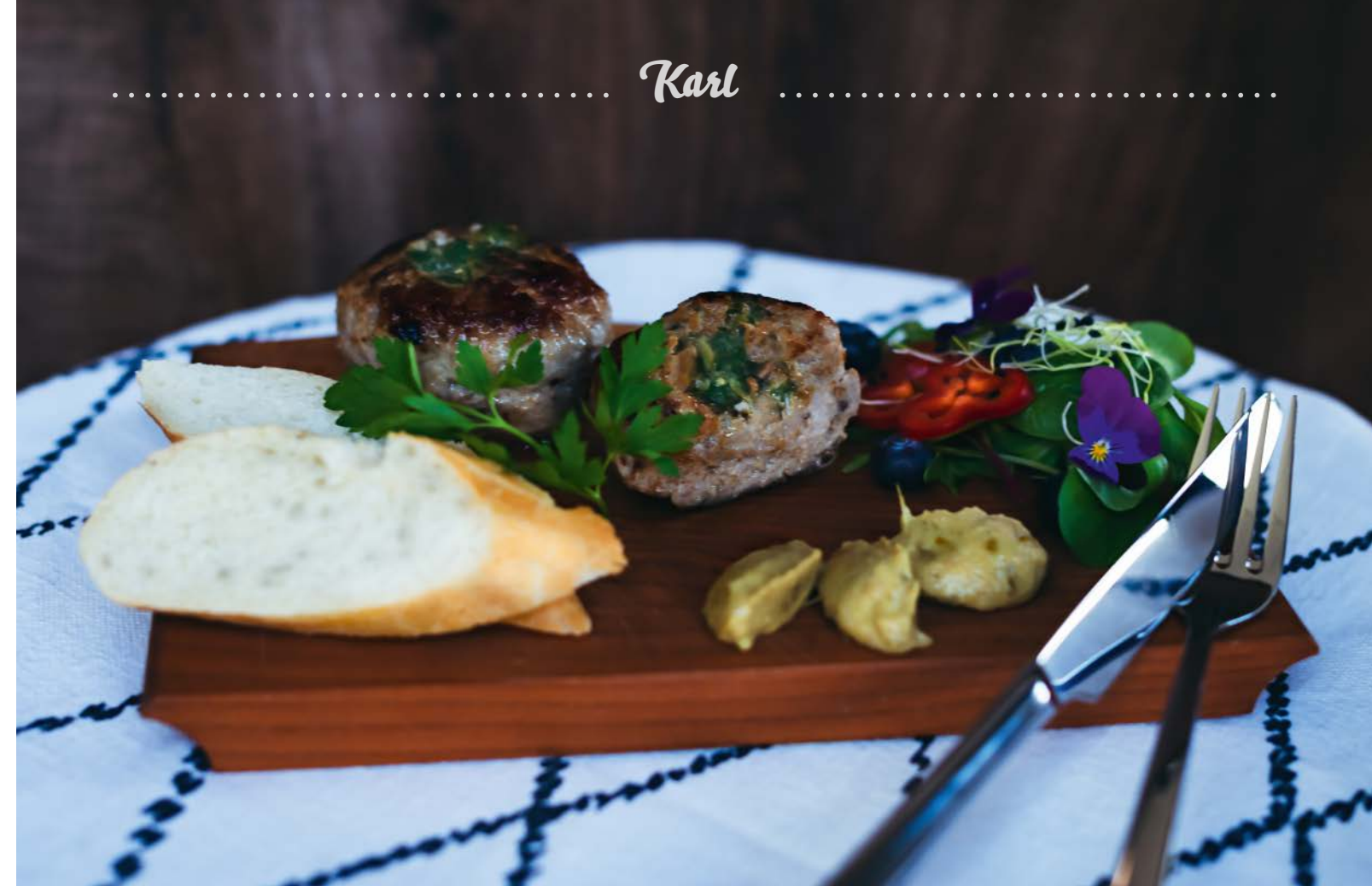
Das Prignitzer Nationalgericht neu interpretiert: Pritzwalker Frikadelle mit Knieper und Liebstöckelsenf.