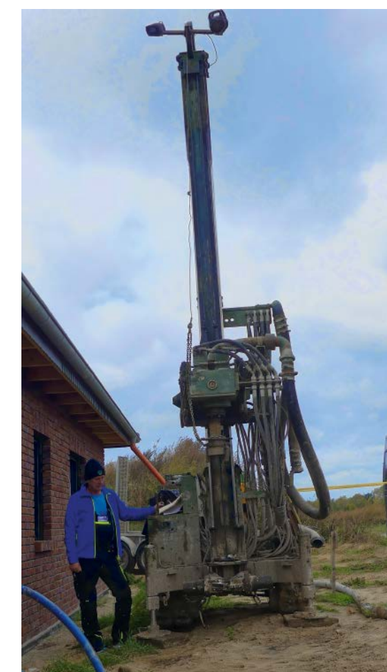
Baustelle für einen Neubau in Perleberg.

100 Meter, wenn die Temperatur langsam steigt, sollte man allerdings den Nutzen gegen die Kosten rechnen.«