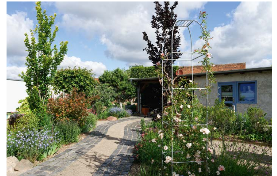
Ein Weg in den »Le Petit Jardin«

Kräuter wachsen und reiche Ernte für Küche und Vorrat liefern.