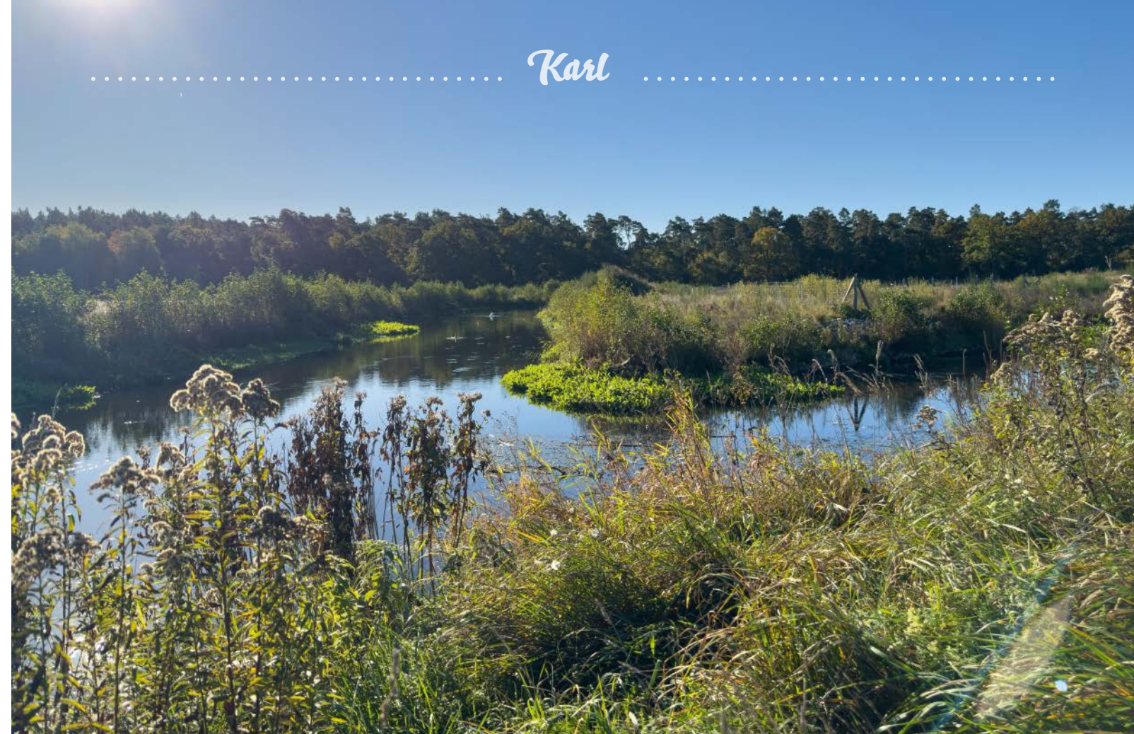
Die Stepenitz bei Weisen: Zur weiteren Renaturierung des Flüsschens hat der Wasser- und Bodenverband dort eine Schlenke eingebaut. Eine kleine Insel bildete sich.

Das Elektrofischen zur Kontrolle der Heimkehrer hat begonnen, vorn im Boot Mirko Beutling.