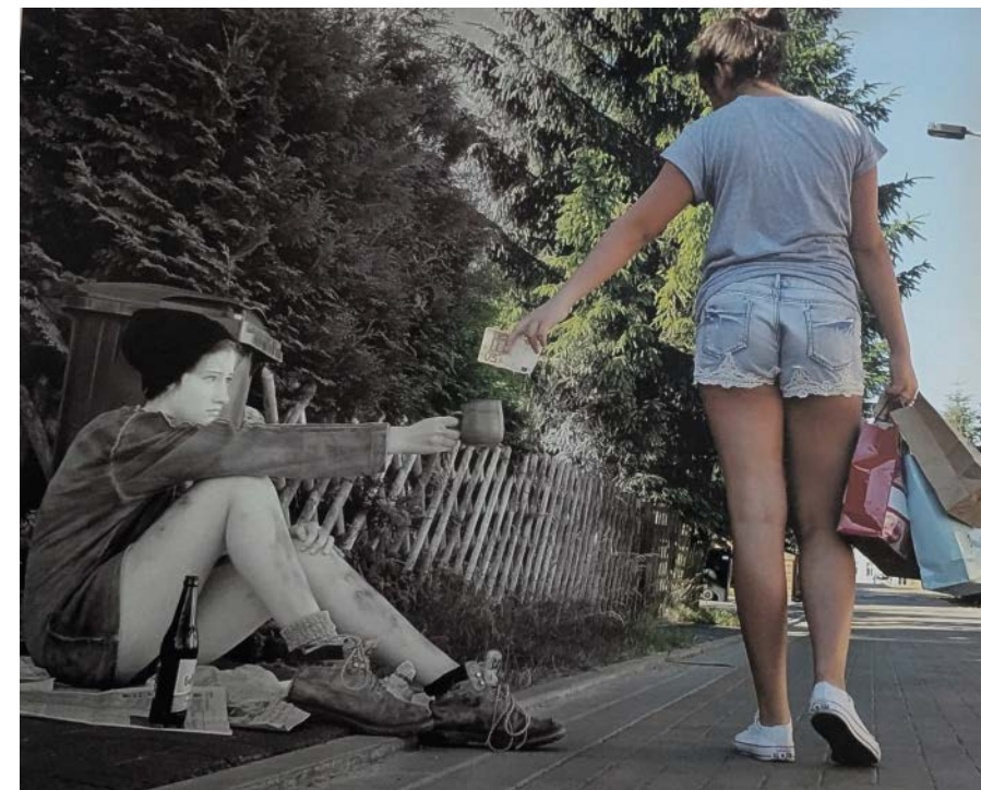
In einer Wanderausstellung »Armut und Reichtum« mit 80 gestalteten Fotos haben Schülerinnen und Schüler ihre Sicht auf das Thema dargestellt. Sie wurde erfolgreich in Prignitzer Einrichtungen bis hin zur Landesregierung in Potsdam gezeigt.