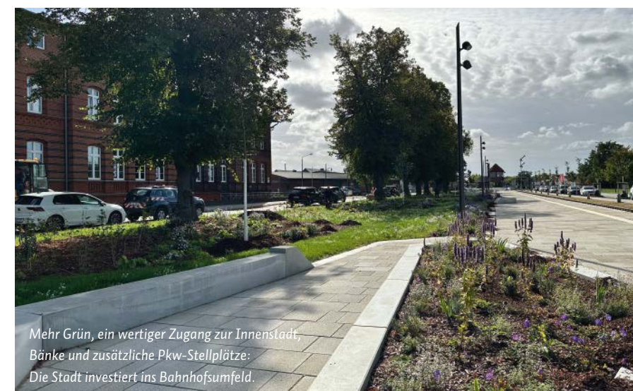
Mehr Grün, ein wertiger Zugang zur Innenstadt, Bänke und zusätzliche Pkw-Stellplätze: Die Stadt investiert ins Bahnhofsumfeld.

Auch den Vorplatz des Empfangsgebäudes lässt die Kommune aufwerten. Hier entsteht eine Empore mit Treppe, denn die Gebäudezugänge befinden sich künftig an der West- statt an der