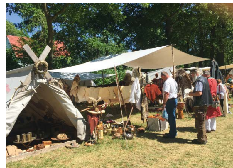
Von der Kulturscheune werden auch Events wie der Wikingermarkt organisiert.

möglichkeit für Touristen und Gäste, die in Schilde feiern möchten. Die Einzel- und Doppelzimmer sind im Landhausstil eingerichtet, jedes Zimmer hat seinen eigenen Charakter. Die moderne und individuelle Ausstattung lässt keine Wünsche offen, bequeme Boxspringbetten sorgen für einen erholsamen Schlaf und die großzügigen und modernen Badezimmer lassen den Start in den neuen Tag komfortabel beginnen. Alle Zimmer sind mit kostenfreiem WLAN ausgestattet.