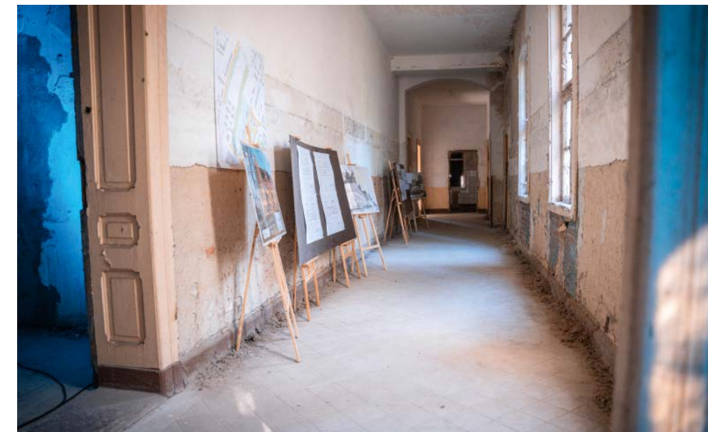
In der seit über 30 Jahren nicht mehr genutzten Abteilungskaserne sollen Wohnungen entstehen.

Es geht in der Kurmärker Straße weiter. Die GWG nimmt sich die das Areal prägende, fast riesige Abteilungskaserne vor. In ihrem Innern sollen