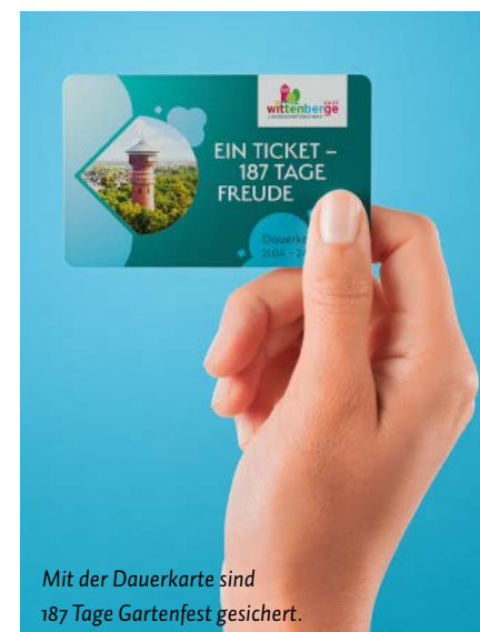
Mit der Dauerkarte sind 187 Tage Gartenfest gesichert.

karten dann zum normalen Eintrittspreis von 150 Euro pro Besuchenden erworben werden. Aber auch diese Ausgabe lohne auf jeden Fall, »denn Wittenberge richtet an 187 Tagen das Fest der Garten- und Stadtkultur mit Genuss, Spaß und mehr als tausend Veranstaltungen aus. Wir sprechen alle Sinne an und schaffen Neues mit Nachhaltigkeit über 2027 hinaus«,