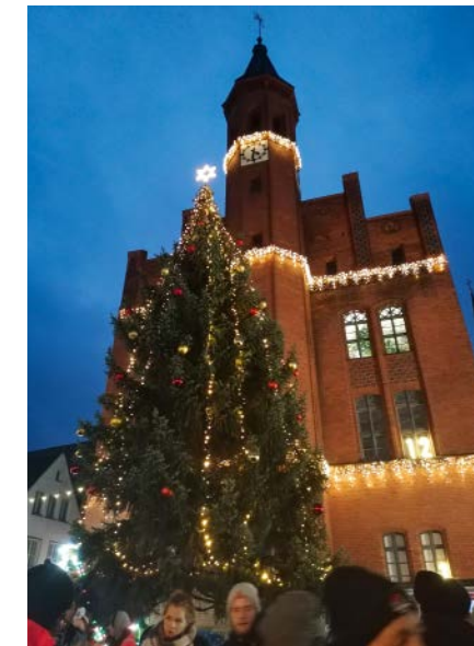
Der Weihnachtsbaum vor dem Rathaus leuchtet die Adventszeit ein.

Nur wenige Wochen später verwandelt sich der Große Markt erneut – diesmal in ein funkelnbes Weihnachtsdorf. Vom 17. bis 21. Dezember lädt der Perleberger Weihnachtsmarkt zum Bummeln, Genießen und Verweilen ein. Die feierliche Eröffnung findet am 17. Dezember um 11 Uhr statt. Der Bürgermeister begrüßt gemeinsam mit Kindern aus den Perleberger Kitas die Gäste und schneidet anschließend den traditionellen Weihnachtsstollen der Bäckerei Eichler an – ein süßer Auftakt zu fünf festlichen Tagen.